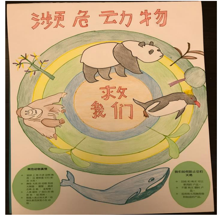
五年级卓越班 温小玉 Jade