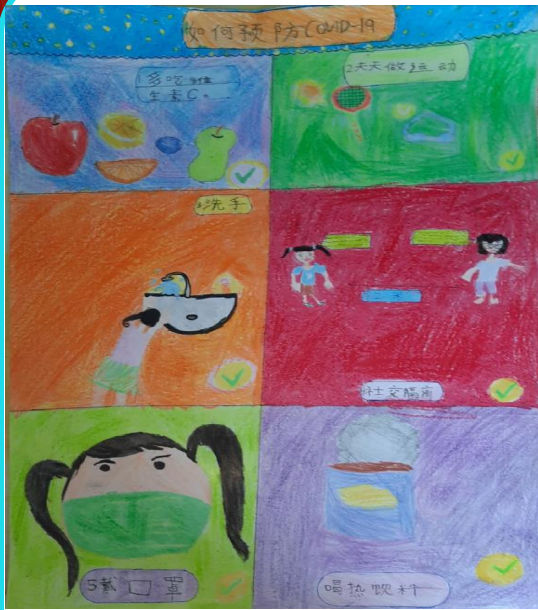
四年级卓越班 张嘉欣 Grace