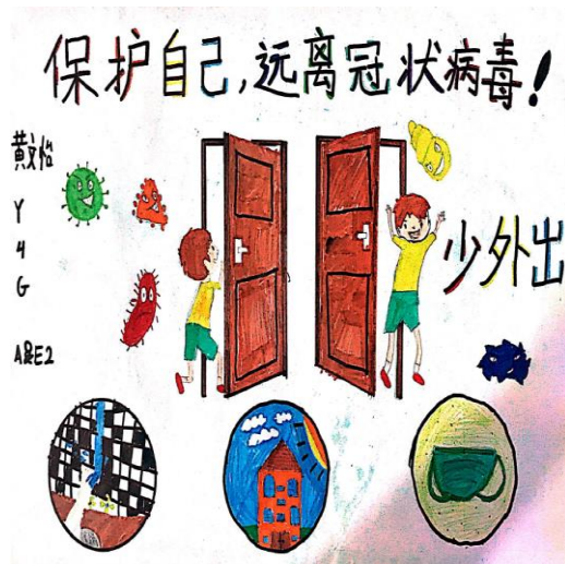
四年级优雅班 黄文怡 Ashley