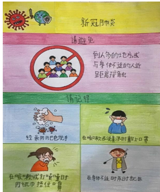
四年级优雅班 颜琪洋 Clifton