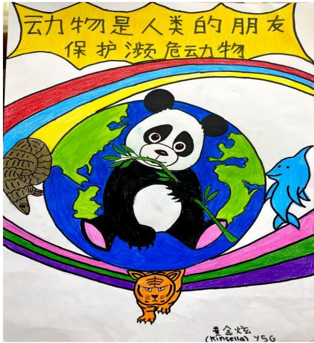
五年级优雅班 黄金炫