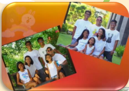
Y6 Foundation Chinese Qiusha 雪灵

Please Click the picture to watch the video!