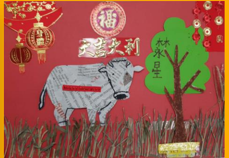
Y3I Darsten 林永星