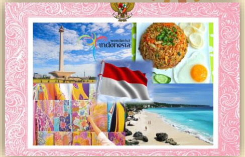
Y3A Raphael 洪伟恩