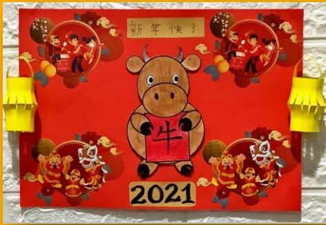
Y3I Aubrey 佩琳