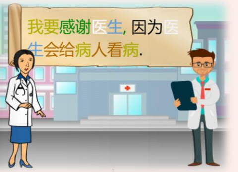
Y2A 来西 Lizette Ximone Acabado